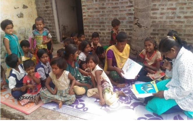
ऊस तोड मजूरांच्या मुलांसाठी चालवलेली सेवांकर साखर शाळा

इचलकरंजीतूनही अनेक शिक्षक, कार्यकर्ते पुण्यात ज्ञान प्रबोधिनीच्या विविध शिक्षक प्रशिक्षण शिबिरांमध्ये, प्रबोधिनी परिचय सहलींमध्ये सहभागी झाले. काही कार्यकर्त्यांनी