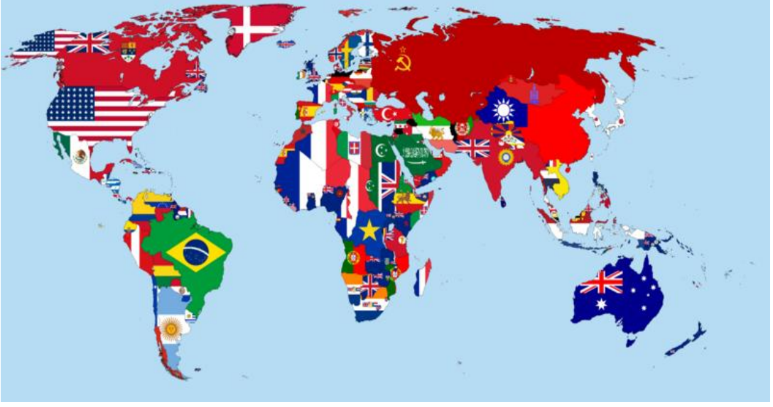
चित्र १ - दुसऱ्या महायुद्धापूर्वीच्या जगाचा राजकीय नकाशा (जगाच्या वेगवेगळ्या भागांतील राज्यकर्त्यांच्या झेंड्यांद्वारे)