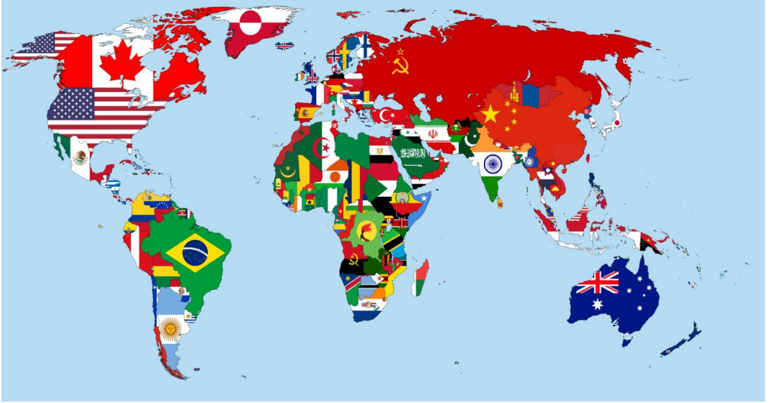
चित्र २ - विसाव्या शतकाच्या अखेरीस जगाचा राजकीय नकाशा (जगाच्या वेगवेगळ्या भागांतील राज्यकर्त्यांच्या झेंड्यांद्वारे)

१९४४ मध्ये जागतिक भांडवलदारी अर्थव्यवस्थेचा पाया मजबूत करण्याच्या दृष्टीने अमेरिकेच्या पुढाकाराने जागतिक बँक आणि आंतरराष्ट्रीय नाणेनिधी स्थापन केले गेले. १९४५ साली संयुक्त राष्ट्रसंघाची स्थापना झाली. एका दृष्टीने जगभर पसरलेल्या सर्व मानवी समाजाचा एकत्रित विचार करण्याची ही सुरुवात होती असेही म्हणता येईल.