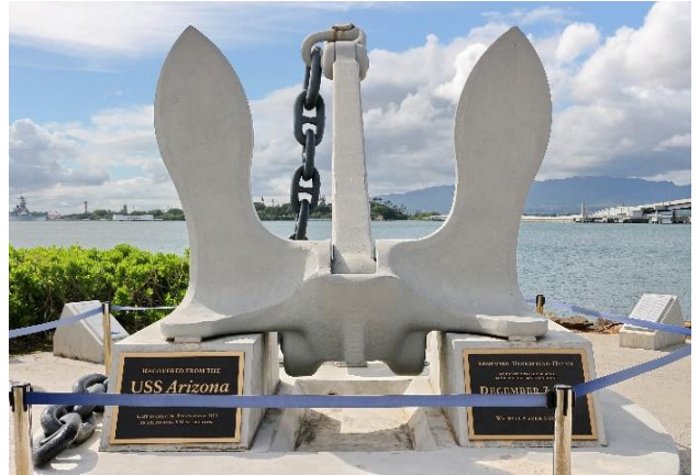
पर्ल हार्बर युद्ध स्मारक

दुसऱ्या महायुद्धात एकीकडे जर्मनीद्वारे माणसे किती पराकोटीची क्रूर बनून, किती मोठा नरसंहार करू शकतात, याचे उदाहरण जगापुढे आले. दुसरीकडे युद्धाची सांगता