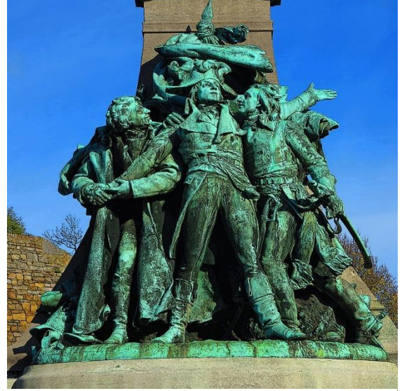
फ्रेंच राज्यक्रांतीचे प्रतिकात्मक शिल्प

सर्वसामान्यांचे दैनंदिन जीवन खडतर बनत गेले. इंग्लंडबरोबरील वैरापोटी फ्रान्सच्या राजेशाहीने अमेरिकेतील ब्रिटिश वसाहतींना स्वातंत्र्यलढ्यासाठी सैनिक आणि शस्त्रास्त्रे पाठवून मदत केली. एकीकडे सरंजामदारांची आर्थिक उधळपट्टी चालूच होती, त्यात या खर्चाची भर पडली. परिणामतः देशात आर्थिक दिवाळखोरीची परिस्थिती निर्माण झाली.