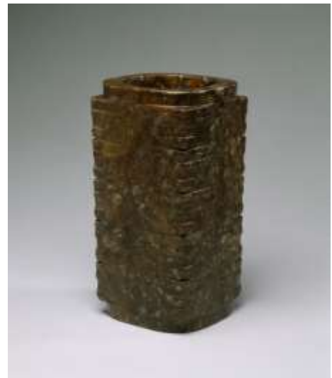
प्राचीन चीनमधील ब्रॉंझ (डावीकडे) व पोवळ्यापासून (उजवीकडे) बनवलेल्या वस्तू.