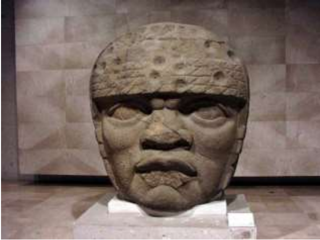
ओलमेक मस्तकशिल्प

इ.स. पूर्व १२०० पर्यंत सध्याच्या मेक्सिकोच्या आखाती भागात ओलमेक संस्कृती चांगल्यापैकी विकसित झाली होती. ओलमेक लोकांचे वैशिष्ट्य म्हणजे त्यांचे भव्यदिव्य कलाविष्कार.